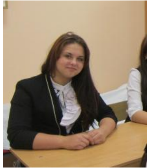
Литвинова Ксения министр культуры