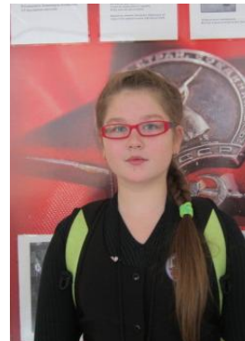
Захарова Арина министр образования