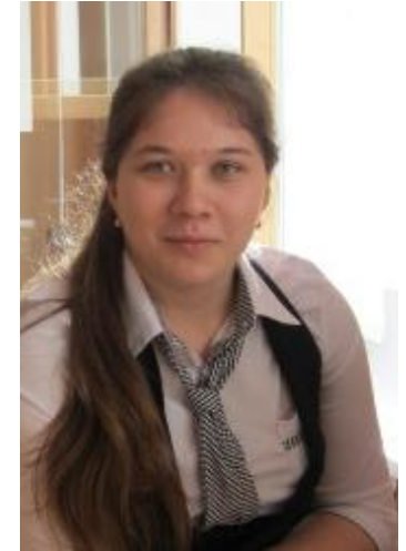
Ганина Диана президент