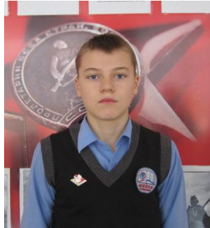
Чанчиков Женя министр спорта