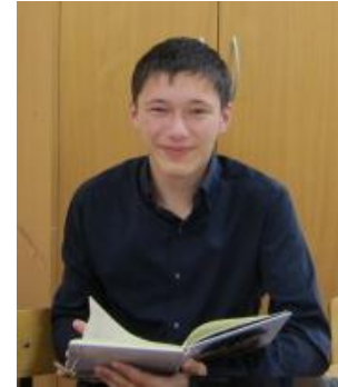
Балакирев Дима министр печати