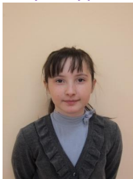
Серегина Лиза министр без портфеля